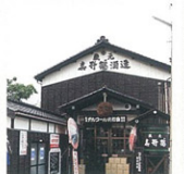
尾畑酒造株式会社 ●新潟県佐渡市真野新町449 ☎0259-55-3171

佐渡米と尾畑酒造のお酒が相乗効果をなし今後世界に佐渡の名を広めていくことだろう。