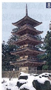
7 奈良の長谷寺を模したといわれる長谷寺(ちようこくじ) 8 新潟県内唯一の五重塔を持つ妙宣寺