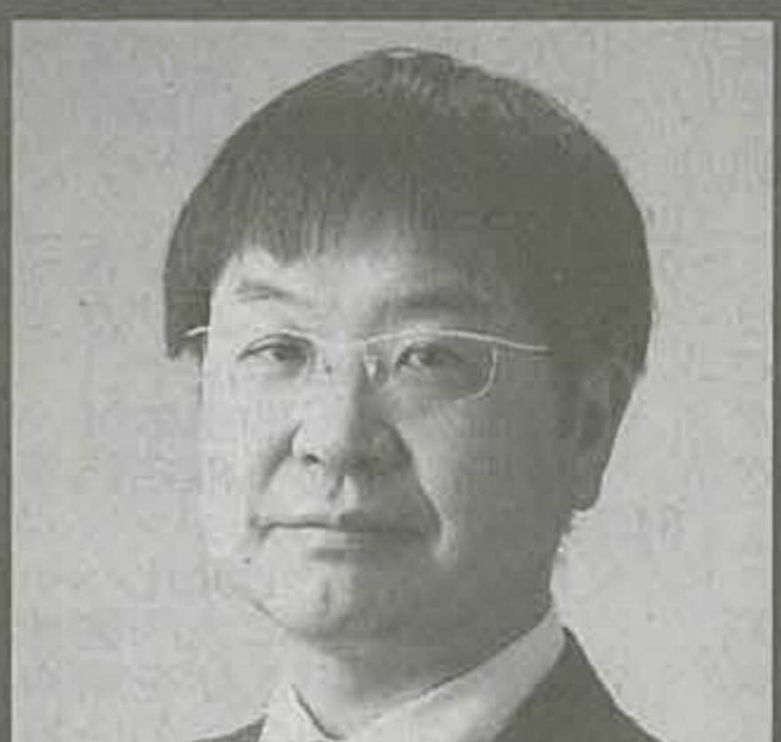
神成 淳司氏 慶應義塾大学環境情報学部教授/ 内閣官房情報流通技術(IT) 総合戦略室室長代理 兼 副政府CIO